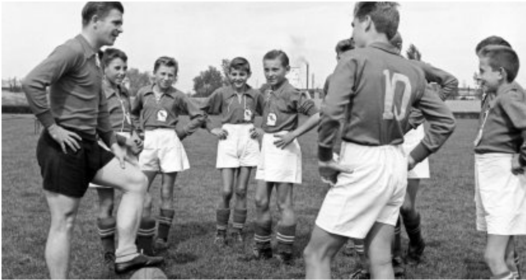
Öcsi bácsi, a legismertebb magyar