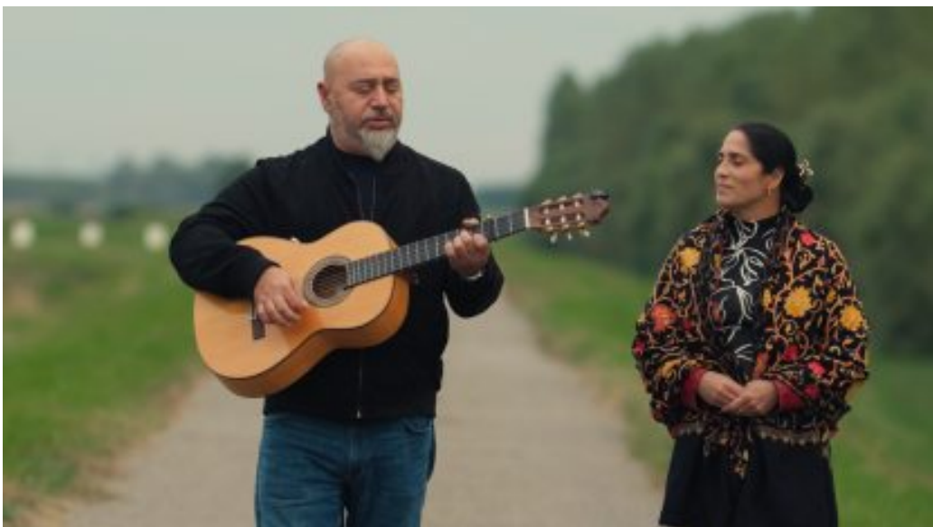
Romengo: Ma magad elé húzod a táskád, ha cigányt látsz a buszon, holnap egy jó koncert jut az eszedbe