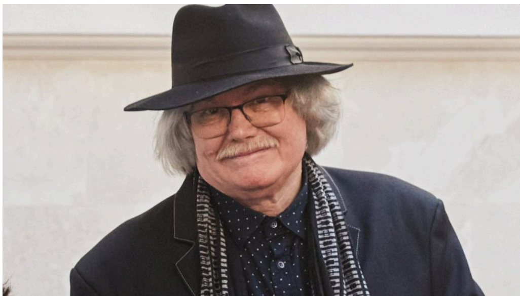
Temesi Ferenc.

November 30-án lesz hetvenöt éves Temesi Ferenc Kossuth- és József Attila-díjas író, műfordító, a nemzet művésze. Temesi több regényében is eltért a hagyományos elbeszélési formától, előfordult, hogy szótár formába szerkesztette vagy éppen egy sakkjátszma lépései szerint mesélte el történetét.