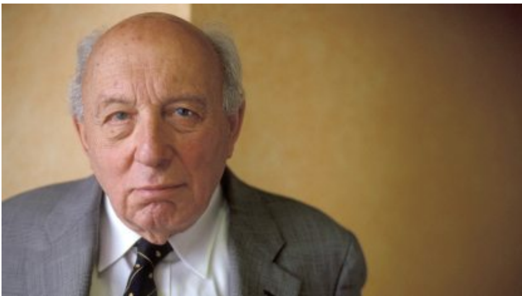
Történész, író, vátesz, mindez együtt John Lukacs