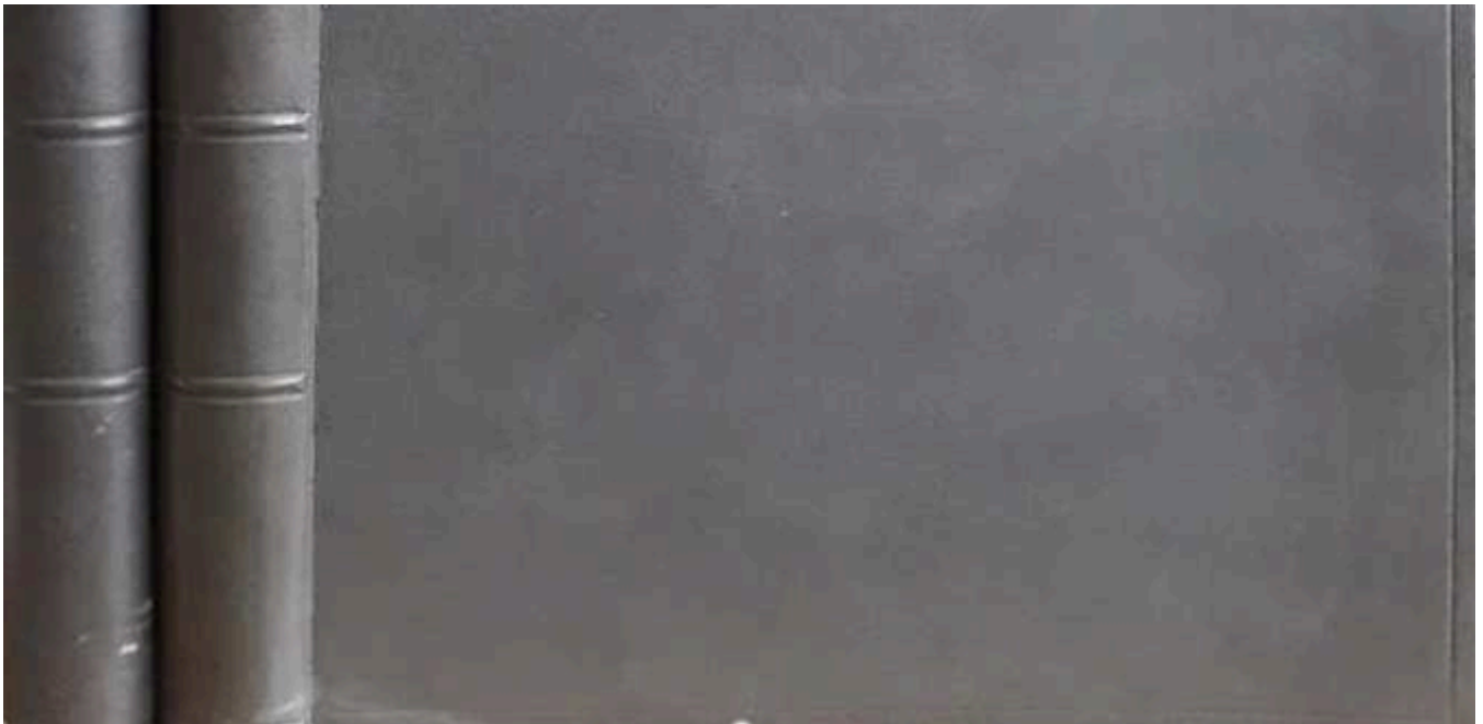
Bártfai Szabó László: Adatok gróf Széchenyi István és kora történetéhez 1808–1860 , Budapest, [Szerző], 1943. Borító – Törzsgyűjtemény .

A kutatási eredmények publikálásán kívül sok előadást is tartott a témában. Egyik emlékezetes szereplése 1920. december 13-án történt, amikor a Széchenyi Ferenc halálának centenáriuma alkalmából a nemzeti múzeumban rendezett emlékünnepségen szónokaként emlékbeszédében a hazája sorsának megjavításáért szüntelenül fáradozó politikusnak és a nemzet múltjának emlékeit összegyűjtő, minden áldozatra kész mecénásnak képét elevenítette fel a hallgatóság előtt.